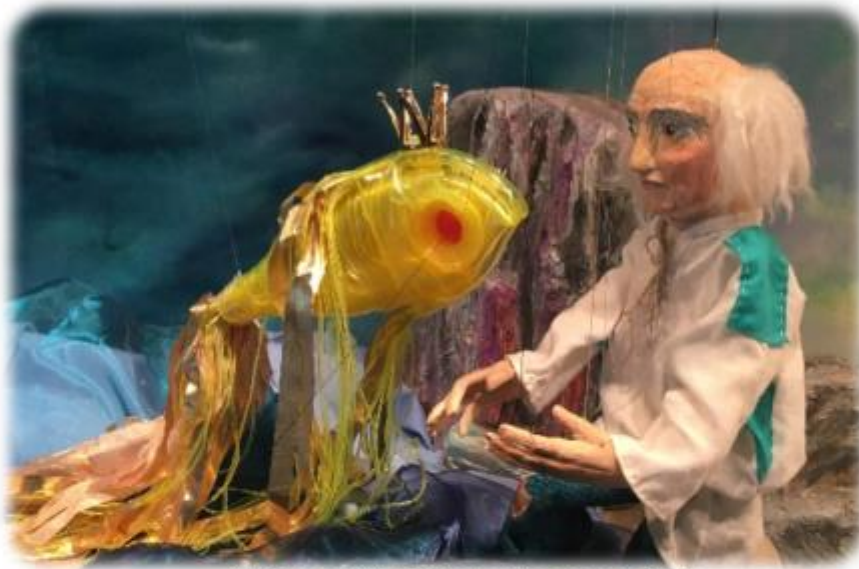
Abbildung aus „Vom Fischer und dem goldenen Fisch“

Samstag, 16. März 2019 ♦ 16:00 Uhr Sonntag, 17. März 2019 ♦ 11:00 Uhr