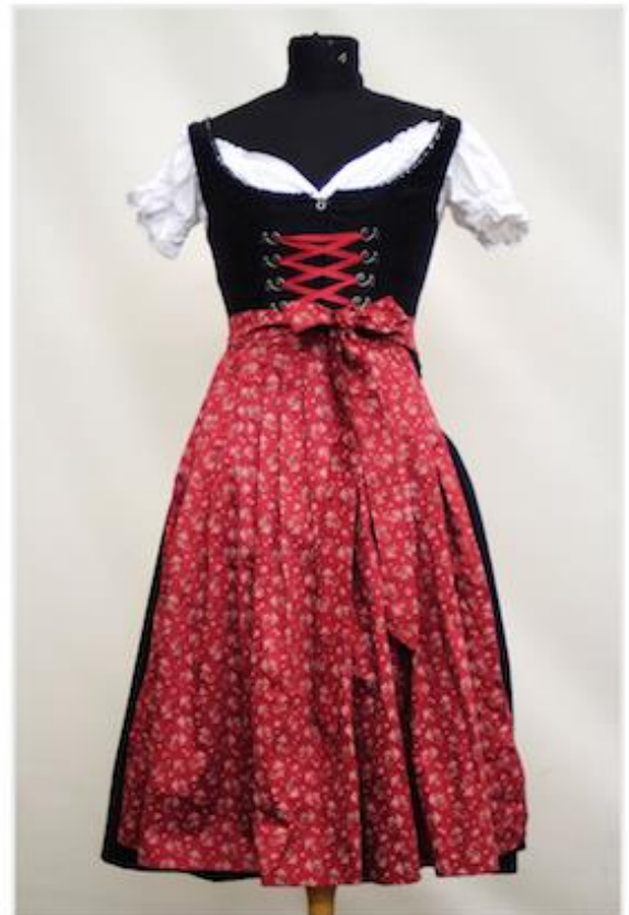
Nele Nicklas – Das Nähen eines Dirndl