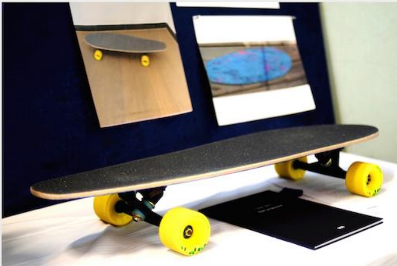
Caspar Schulz – Das Longboard