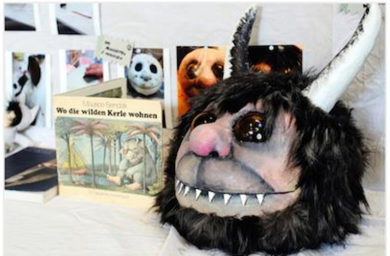
Lou Koch – Erstellen eines Hörbuchs