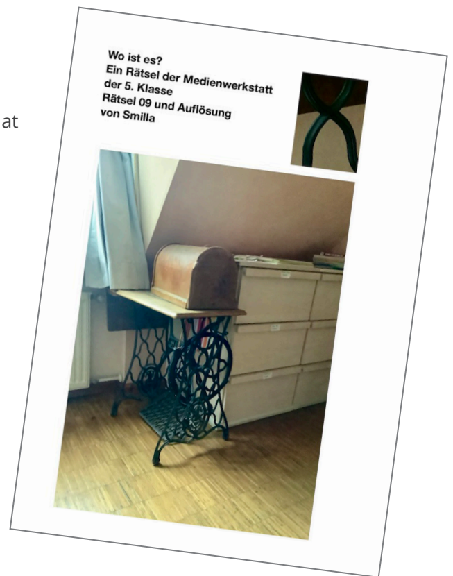
Wo ist es? Ein Rätsel der Medienwerkstatt der 5. Klasse Rätsel 09 und Auflösung von Smilla

Herausgeber: Rudolf-Steiner-Schule Schwabing / Leopoldstraße 17 / 80802 München Telefon 089-38 01 40-0, Fax 089/38 01 40 50 / www.waldorfschule-schwabing.de Mitglied im Bund der Freien Waldorfschulen // Redaktion Wochenblatt / verantwortlich: Claudia Brancato, Judith Huber, Suzanne Söllner // redaktion@waldorfschule-schwabing.de Bankverbindung: Bank für Sozialwirtschaft / IBAN: DE88 3702 0500 0007 8280 00 / BIC: BFSWDE33XXX